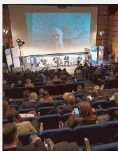
Il forum all'Acquario di Genova

IL FORUM DELLO SHIPPING DI SECOLO XIX E MEDI TELEGRAPH