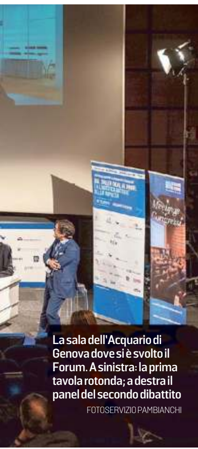
La sala dell'Acquario di Genova dove si è svolto il Forum. A sinistra: la prima tavola rotonda; a destra il panel del secondo dibattito

L'ipotesi del raddoppio a Ponente del terminal di Pra' non è nuova: il tema risale a più di 20 anni fa, e fu fortemente contrastato dagli abitanti della zona. I progetti ciclicamente si riaffacciano nel dibattito cittadino e portuale: nel corso degli anni, per ampliare lo scalo satellite di Genova, sono state prese in considerazione diverse opzioni, come un'estensione a Levante o un nuovo scalo traghetti. —