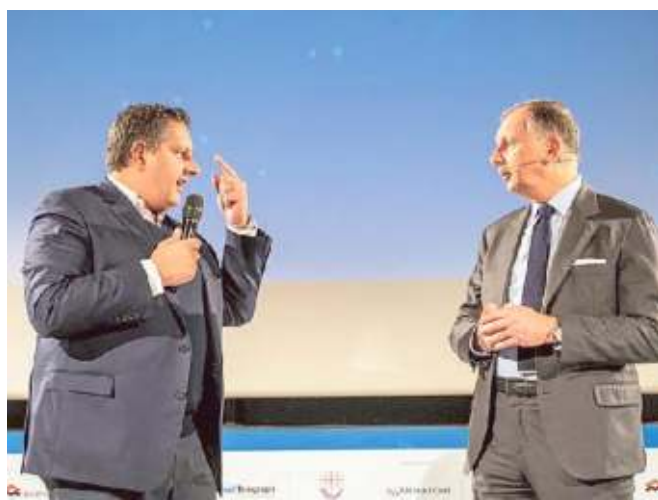
Il governatore Toti e il direttore del Secolo XIX Luca Ubaldeschi