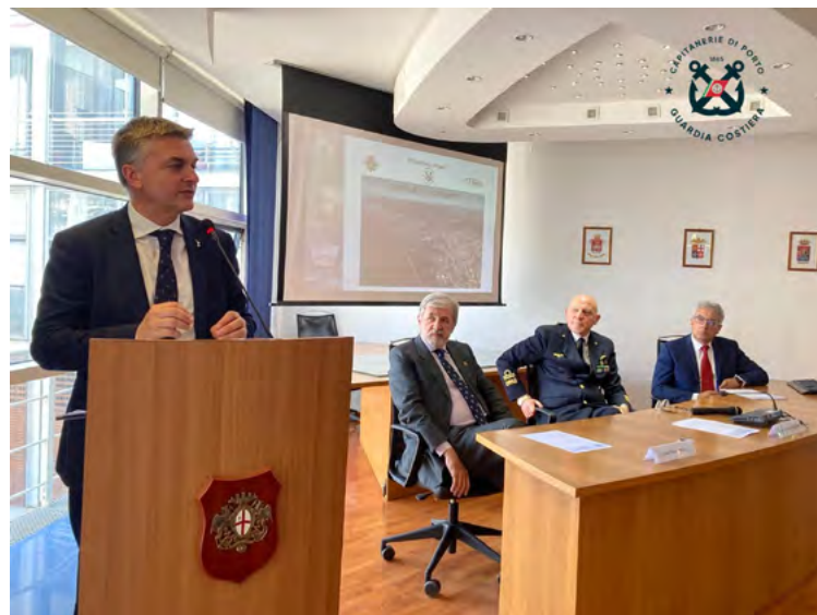
L'intervento del viceministro Rixi

Il rinnovo del Blue Agreement è pienamente in linea con l'obiettivo strategico di accrescere la sostenibilità ambientale delle attività portuali, che unisce la Capitaneria di Porto di Genova, il Comune di Genova - firmatario per la prima volta dell'accordo - e l'Autorità di Sistema Portuale del Mar Ligure occidentale, che tra l'altro ha varato un'ampia programmazione Green Ports finalizzata alla riduzione dei consumi energetici e al miglioramento della qualità dell'aria. L'impegno comune di tutte le istituzioni coinvolte per la sostenibilità ambientale è essenziale per una città come Genova, dove il porto è connesso al tessuto urbano e le navi ormeggiano in prossimità di aree