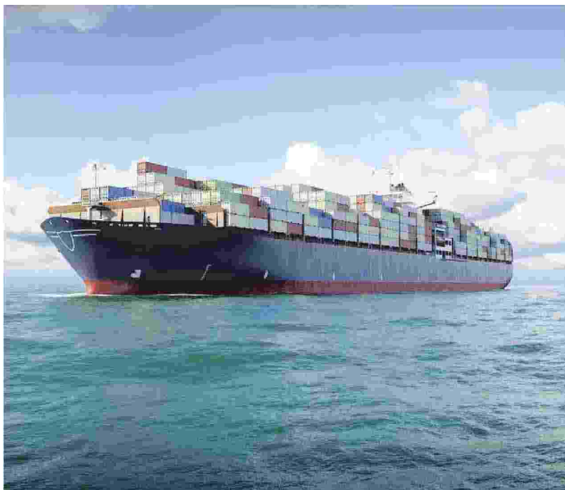
IL RUOLO DI GENOVA È AL CENTRO DEL DIBATTITO

l'esperienza dell'armatore e quindi la prospettiva dell'operatore, oltre che la rappresentanza di un'associazione di categoria. "Prima che pensiamo che le navi vadano a metanolo, ammoniaca, nucleare - osserva Messina - passerà molto tempo. Probabilmente questo scenario è destinato ad accadere, ma io al momento ho in testa un orizzonte di 5-7 anni. Anzi: nell'operatività quotidiana ce l'ho da mattina a sera, nel-